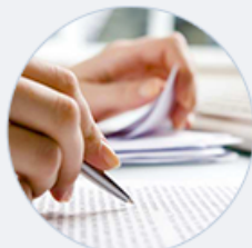
Комментарии и статьи