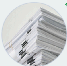
Образцы и формы документов