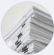
Образцы и формы документов